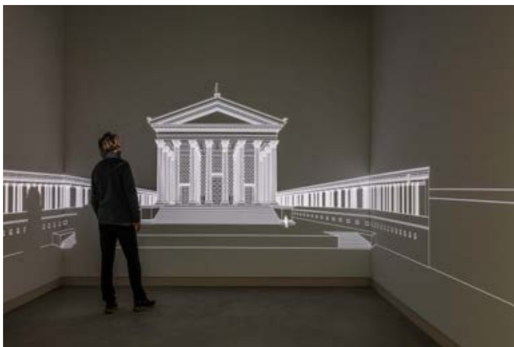
A.Späni © Narbo Via