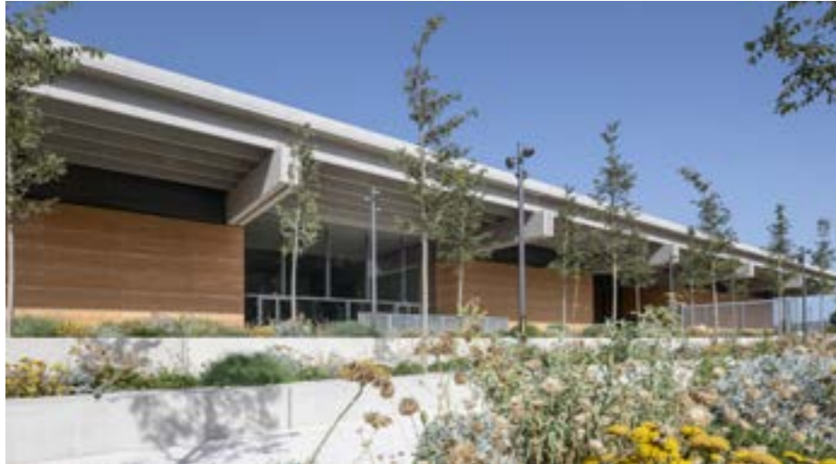
Foster N.Young © Narbo Via

Pensé et conçu comme un véritable lieu de vie, le musée propose plusieurs espaces conviviaux dont une librairie-boutique, de grands jardins et un restaurant. L'ambition étant de faire de Narbo Via non seulement un lieu que l'on visite, mais aussi un lieu que l'on fréquente et où l'on revient avec plaisir.