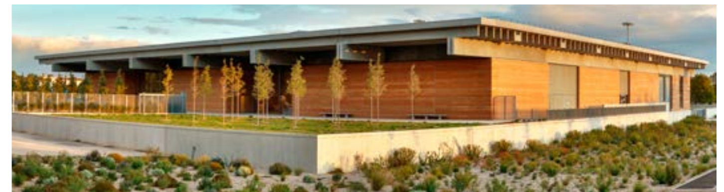
A.Späni © Narbo Via