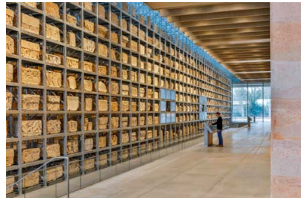
A.Späni © Narbo Via

Elément central du musée, un mur monumental composé de 760 blocs de pierre répartis sur deux rangées, issus pour la plupart des nécropoles romaines de la ville antique, ouvre le parcours des collections. Grâce à un dispositif automatisé inédit dans un musée, permettant de mouvoir les oeuvres au moyen d'un bras de levage robotisé, cette galerie lapidaire restitue le parcours de conservation de ces blocs au fil des siècles. Longue de 76 mètres, elle constitue également une véritable réserve ouverte et une glyptothèque, destinée à faciliter le travail d'étude et de recherche des archéologues, historiens ou scientifiques accueillis au sein du musée.