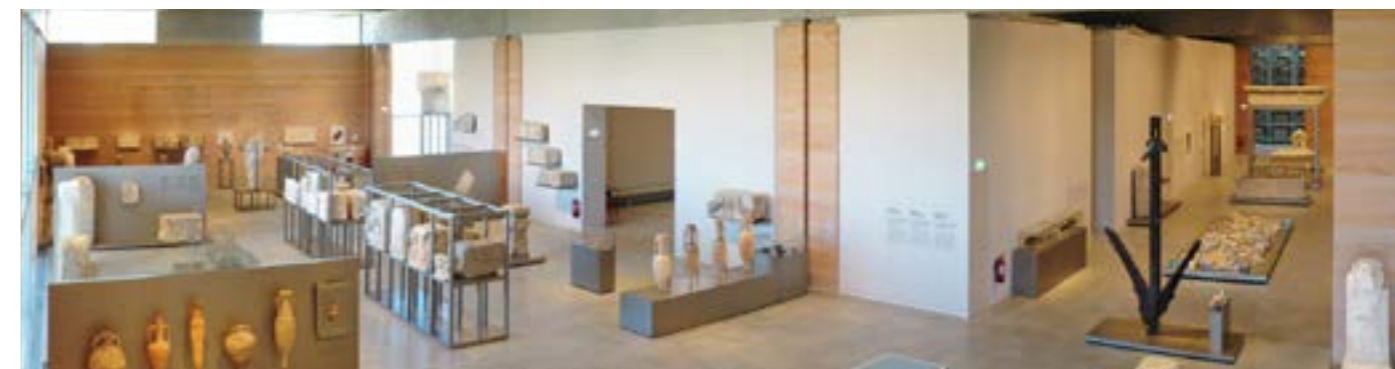
A.Späni © Narbo Via