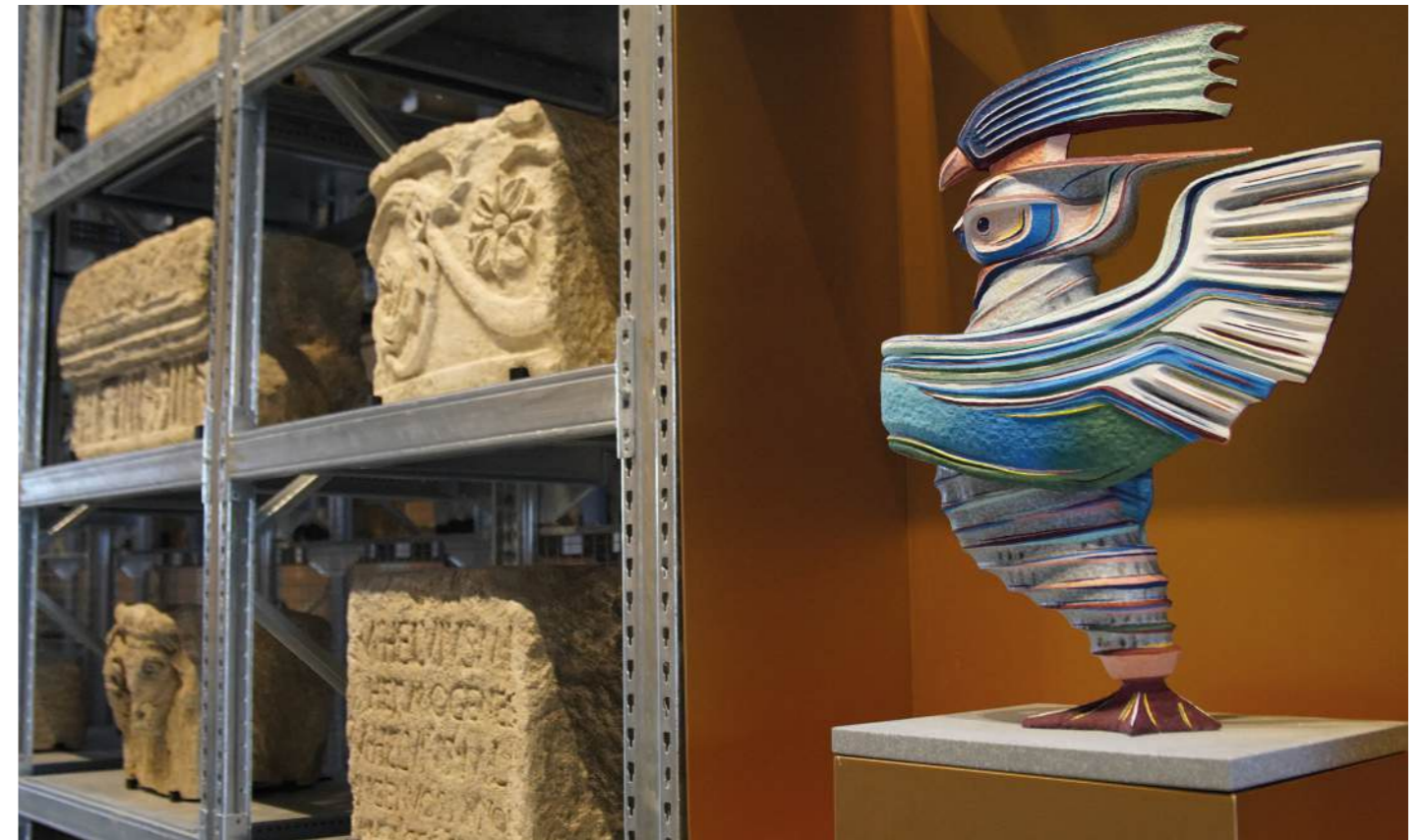
Inclusion, XII Appels