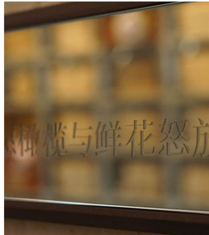
Les reflets