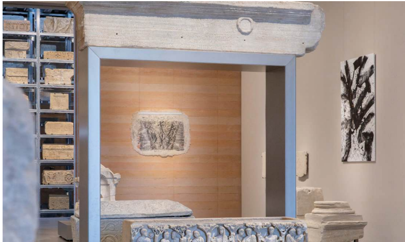
Sa voix, la bravoure | Lumière, matière miraculeuse et La bravoure

Ces oeuvres associent écriture et matière : dessin au fusain, transfert sur toile, puis application de couches de cire chaude, créent ainsi un support semi-transparent qui capte la lumière et rend visible la texture du temps. En écho aux inscriptions du musée, ces oeuvres rappellent que dans le monde romain, l'écrit devient essentiel pour communiquer mais aussi transmettre la mémoire, posant la question de sa maîtrise comme outil de connaissance et de pouvoir