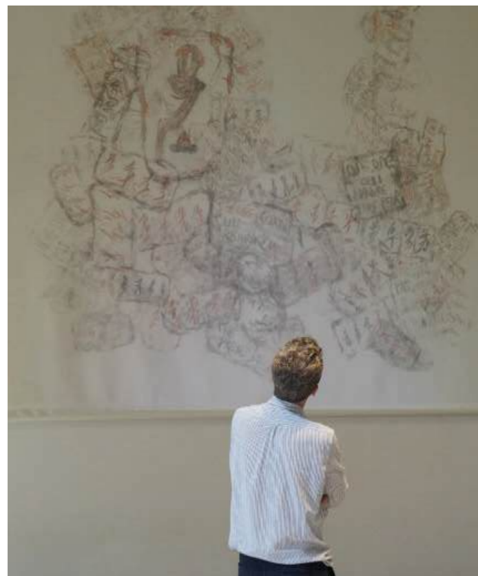
Via Mundus

L'exposition « Le Souffle du Temps » s'inscrit dans la continuité de la recherche artistique menée par Jiang Qiong Er, tout en se déployant dans un nouveau contexte : celui du patrimoine antique de Narbonne. L'artiste investit l'exposition permanente des collections avec une attention particulière portée aux formes symboliques, aux matériaux porteurs de mémoire et aux strates du temps. Certaines oeuvres sont réalisées avec des pigments évoquant les peintures rupestres, faisant écho aux fresques antiques conservées au musée. D'autres, réalisées sur de fines plaques de cire, jouent sur les transparences, les craquelures et les superpositions, créant des surfaces vibrantes où passé et présent se rencontrent. Cette représentation du temps dialogue étroitement avec les artefacts archéologiques de Narbo Via, eux-mêmes porteurs d'usures, de strates et de récits fragmentaires.