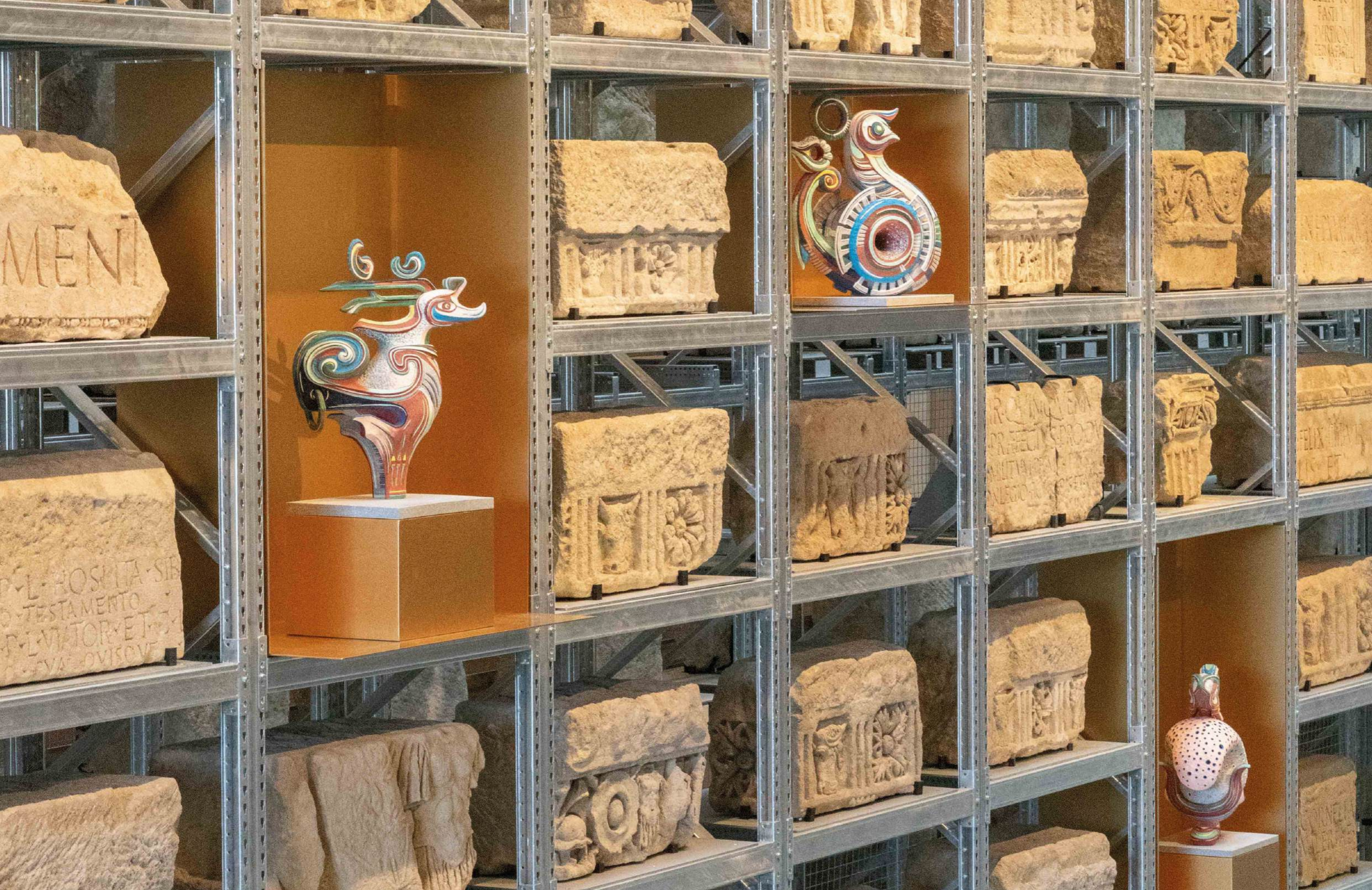
Exploration / Temps / Fraternité, XII Appels