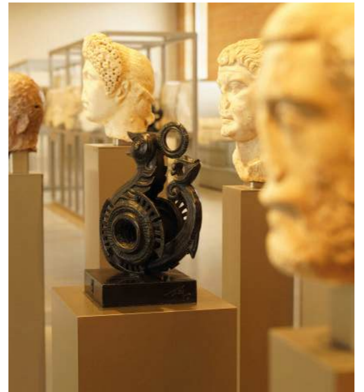
Temps, XII Appels