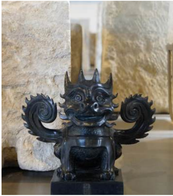
Liberté, XII Appels