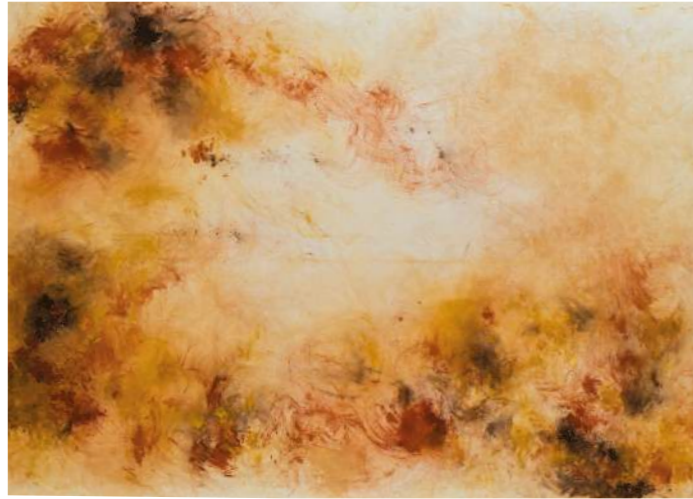
Les anges des grottes ©QEJ Studio