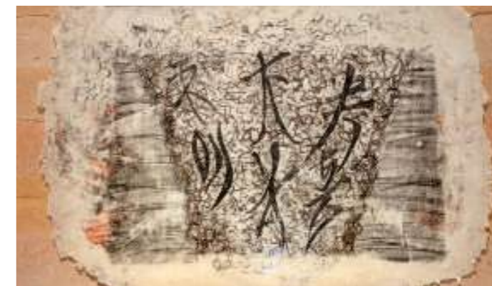
Sa voix, la bravoure