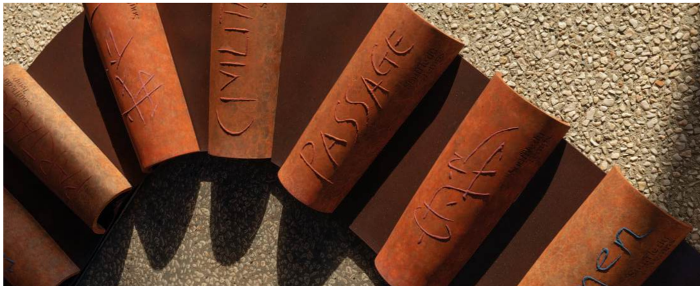
Le Ciel et La Terre