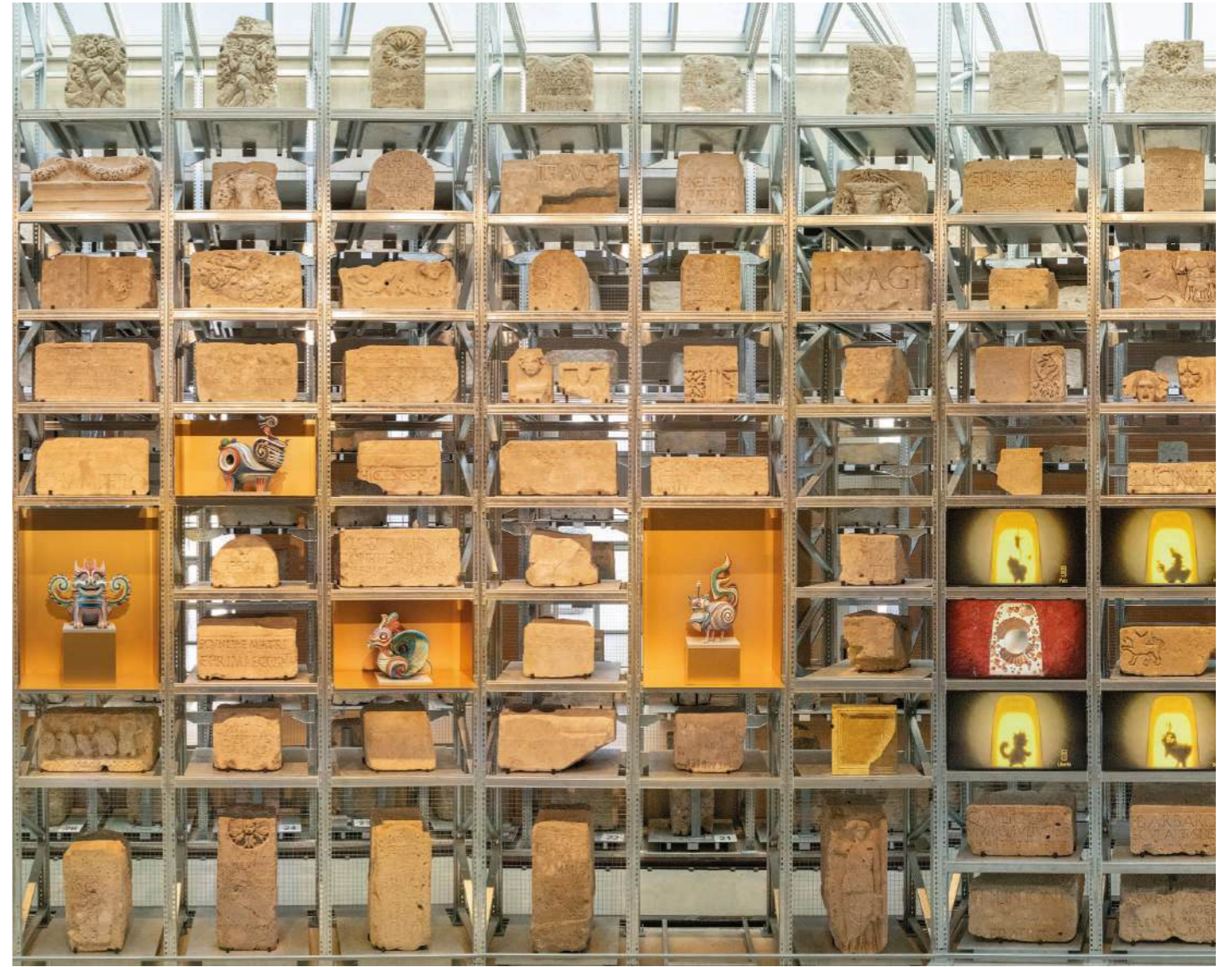
XII Appels