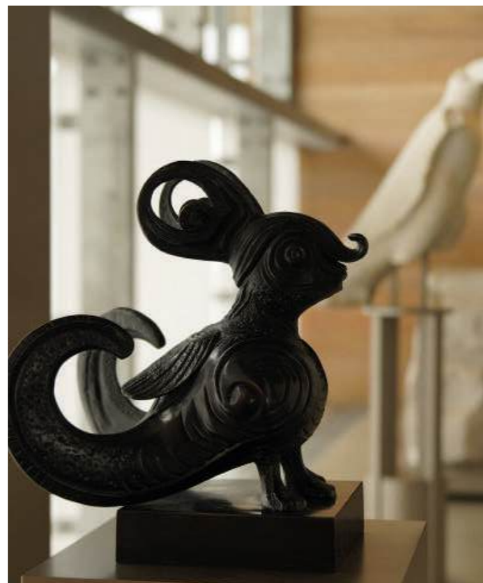
Bienveillance, XII Appels