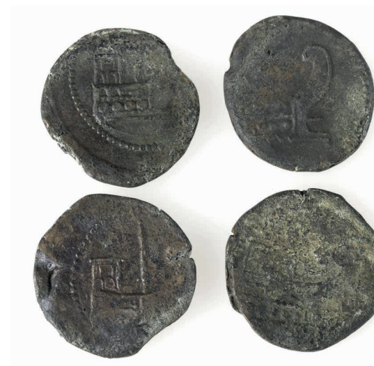
As d'Octave à la proue OFFRE CENTRE DE LOISIRS