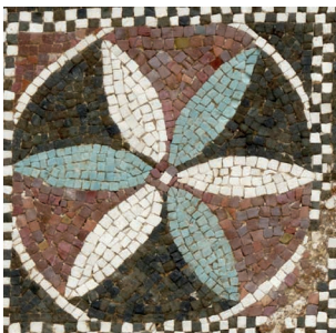
Rosace polychrome de la mosaïque aux griffons

Capacité d'accueil: 1 classe avec 2 accompagnateurs-trices, sur réservation obligatoire.