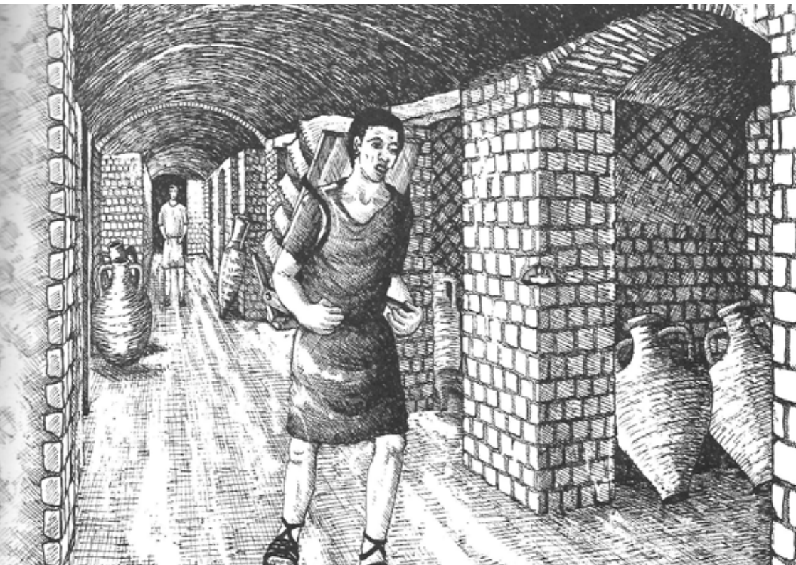
Illustration des galeries de l'Horreum

Capacité d'accueil : 1 classe avec 2 accompagnateurs-trices, sur réservation obligatoire.