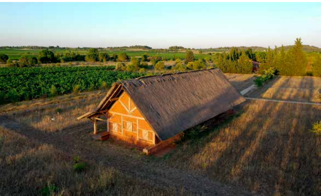
Habitat gallo romain restitué dans le parc d'Amphoralis

Capacité d'accueil : : 1 classe avec 2 accompagnateurs-trices, sur réservation obligatoire.