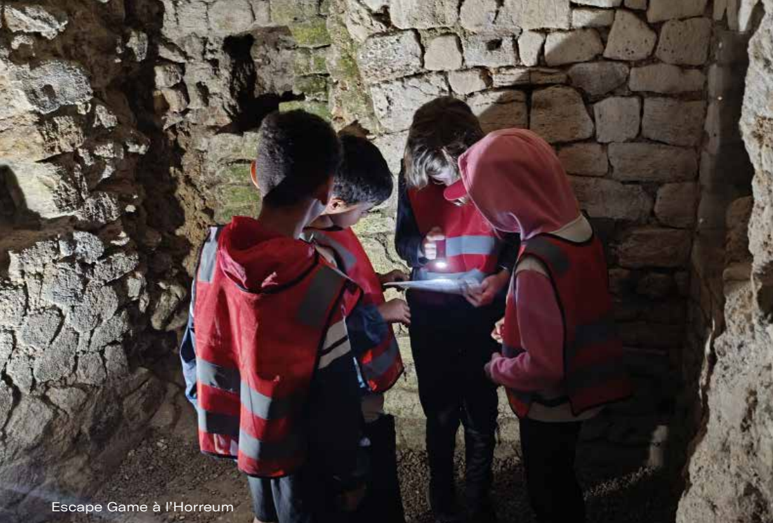
Escape Game à l'Horreum