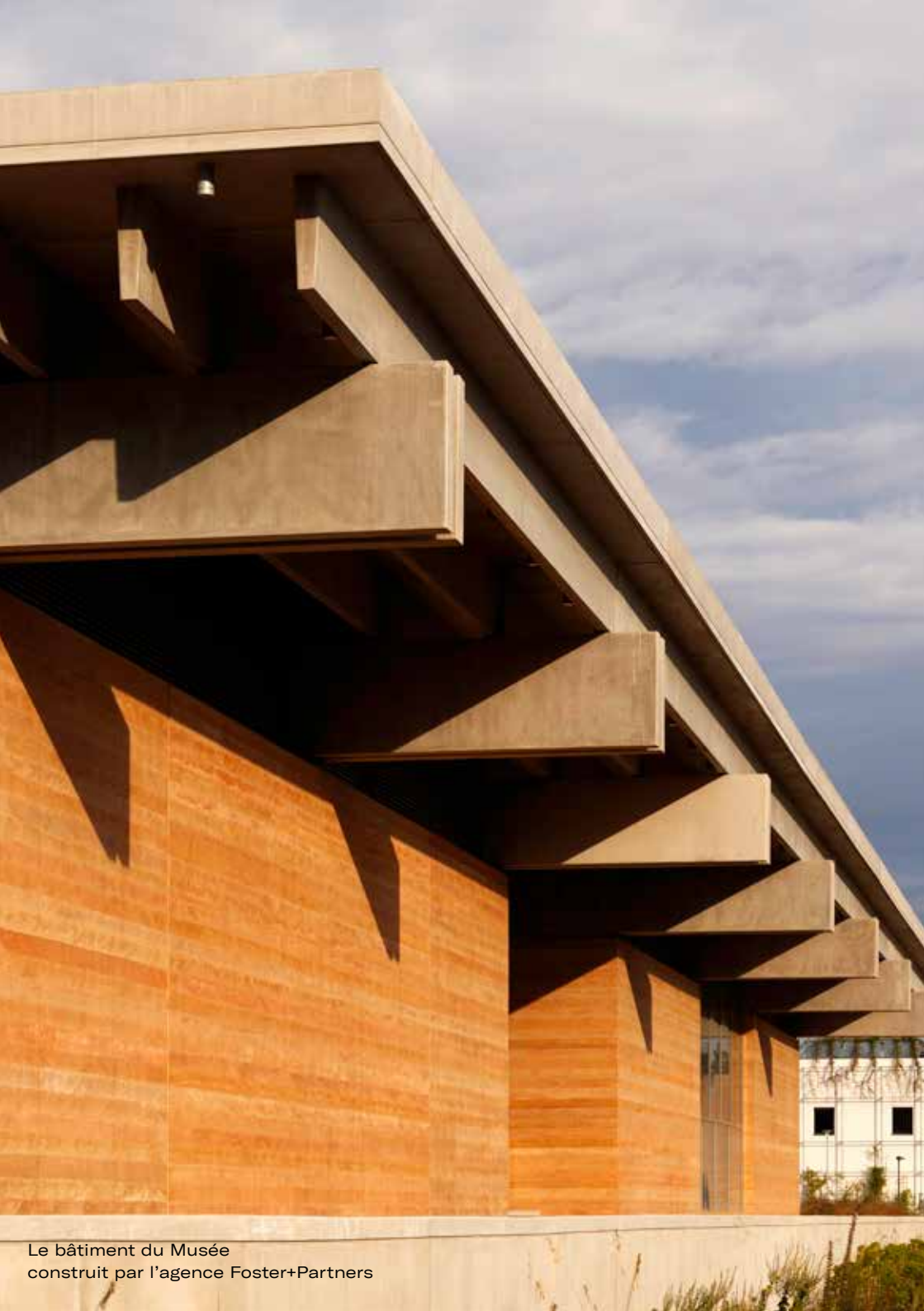
Le bâtiment du Musée construit par l'agence Foster+Partners