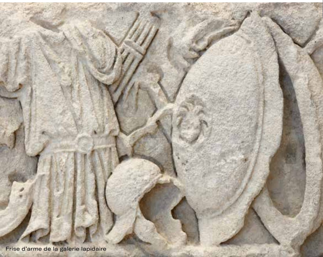
Frise d'arme de la galerie lapidaire

Capacité d'accueil: 1 classe avec 2 accompagnateurs·trices, sur réservation obligatoire.