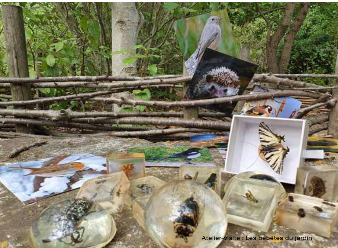
Atelier-visite : Les bêtes du jardin

Capacité d'accueil : : 1 classe avec 1 accompagnateur·trice pour 8 élèves, sur réservation obligatoire.