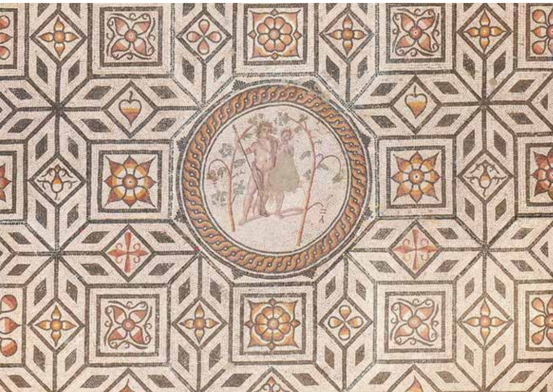
Mosaïque de Bacchus

Capacité d'accueil : 1 classe avec 2 accompagnateurs·trices, sur réservation obligatoire