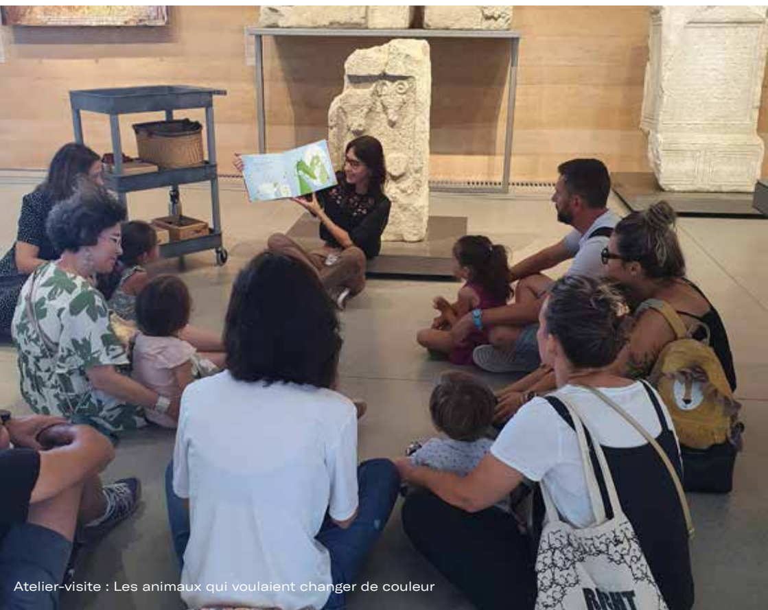
Atelier-visite : Les animaux qui voulaient changer de couleur

Capacité d'accueil : : 1 classe avec 1 accompagnateur-trice pour 8 élèves, sur réservation obligatoire.