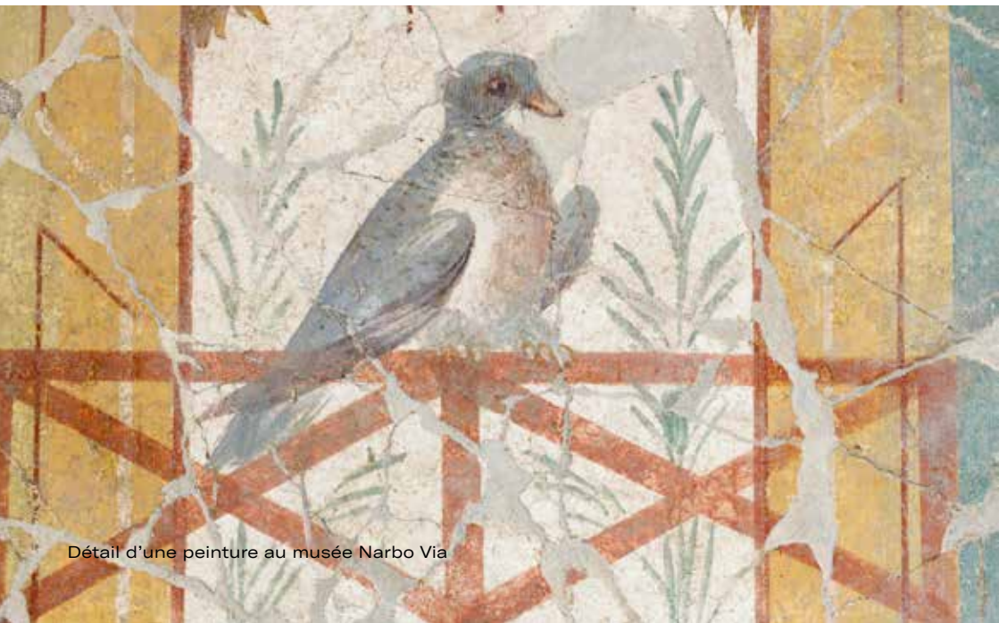
Détail d'une peinture au musée Narbo Via