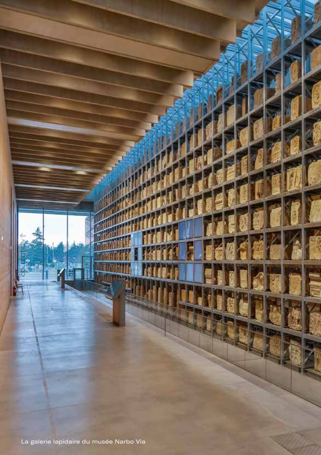
La galerie lapidaire du musée Narbo Via