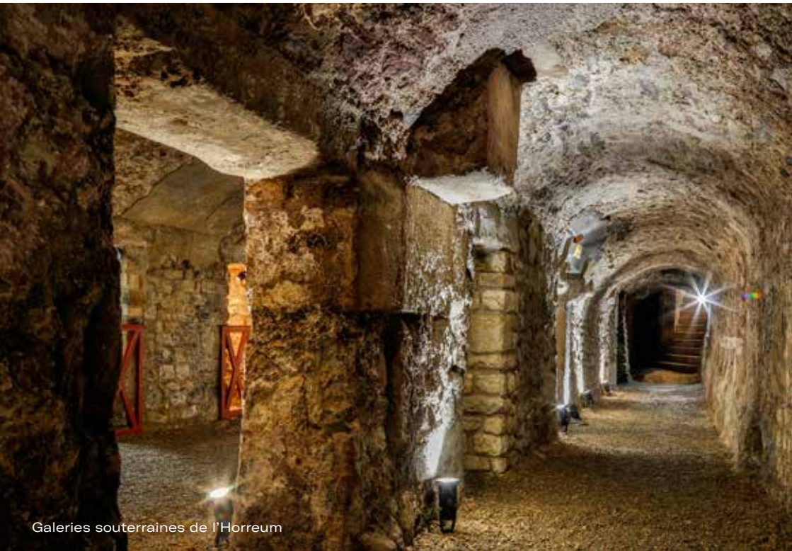
Galeries souterraines de l'Horreum

À prévoir : les enseignant·e·s téléchargent sur le site un dossier pédagogique. Aucune impression ne sera fournie. La réservation est obligatoire.