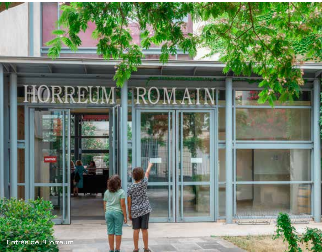
Entrée de l'Horreum

L'Horreum, au cœur de la ville moderne, se compose de galeries souterraines construites au I er siècle avant notre ère et situées à 5 mètres sous terre. Elles devaient constituer les fondations d'un bâtiment, sans doute un marché ou un entrepôt ( horreum signifie « entrepôt » en latin), dont la recherche n'a pas encore découvert tous les secrets. Cet édifice se trouvait au sud du forum , en bordure du cardo (axe nord-sud) de la ville romaine de Narbo Martius . Avec les vestiges archéologiques du site du Clos de la Lombarde, l'Horreum est l'un des seuls monuments romains visibles et visitables au centre de Narbonne.