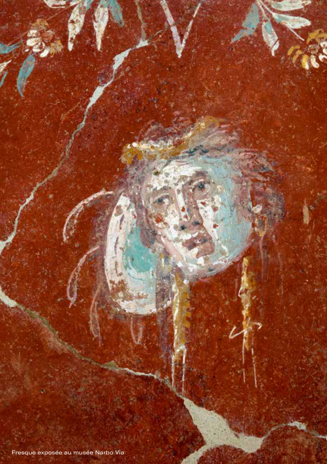
Fresque exposée au musée Narbo Via