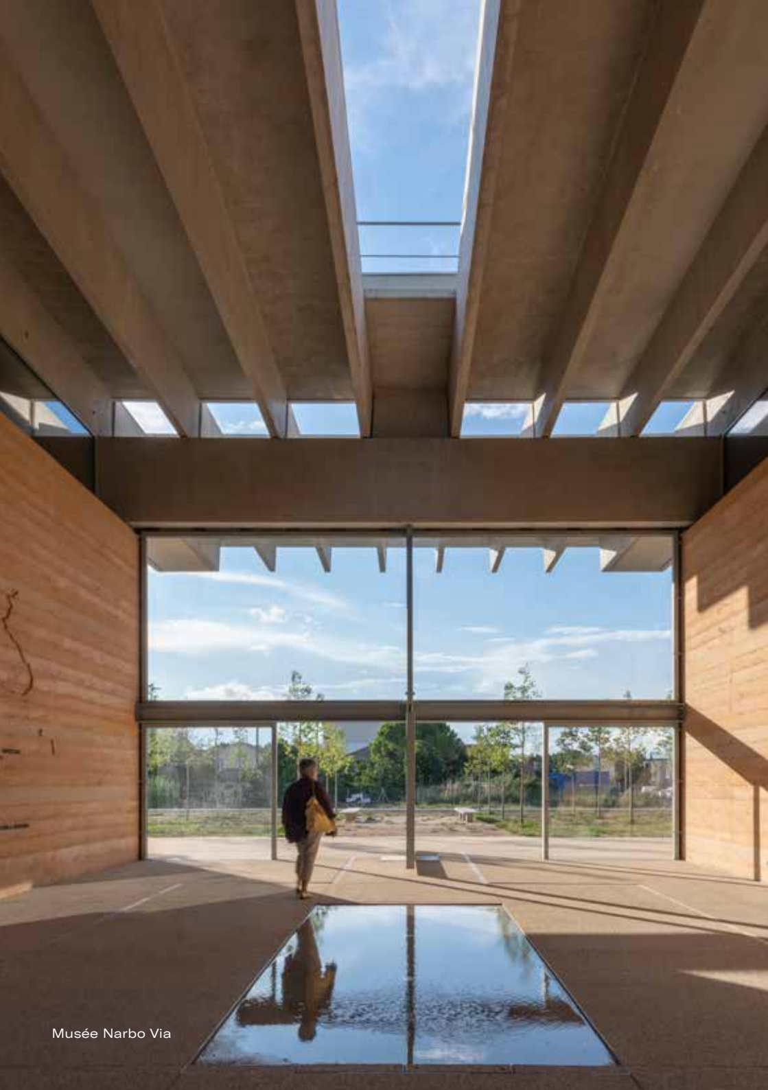
Musée Narbo Via