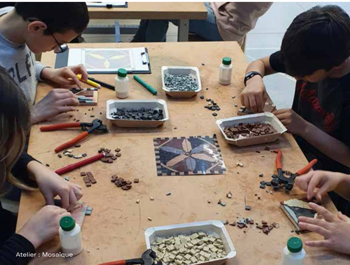
Atelier : Mosa  que

Capacit   d'accueil : : : 1 classe avec 2 accompagnateurs-trices, sur r  servation obligatoire.