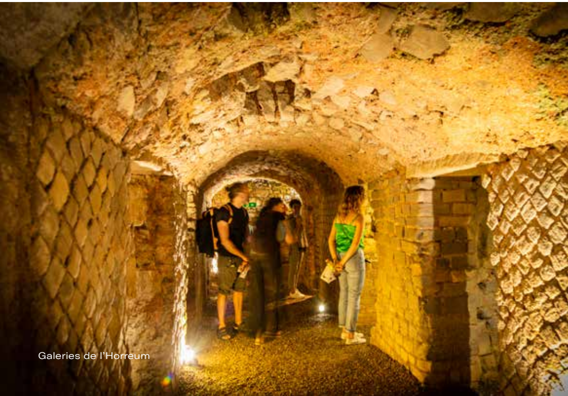
Galleries de l'Horreum

Capacité d'accueil : 1 classe avec 2 accompagnateurs·trices, sur réservation obligatoire.