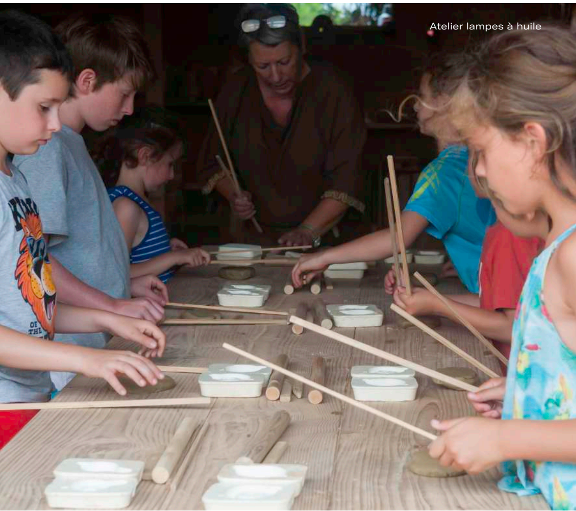
Atelier lampes à huile

au Musée 1 classe avec 2 accompagnateurs-trices / à Amphoralis selon la saison 1 classe ou ½ classe avec 2 accompagnateur-trices, sur réservation obligatoire.