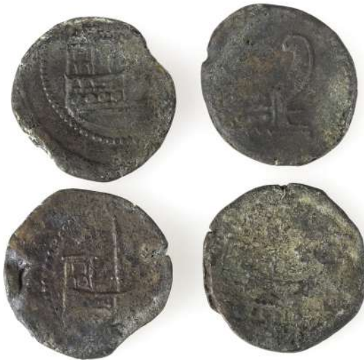
As d'Octave à la proue

au Musée 1 classe avec 2 accompagnateurs-trices / à Amphoralis selon la saison 1 classe ou ½ classe avec 2 accompagnateurs-trices, sur réservation obligatoire.