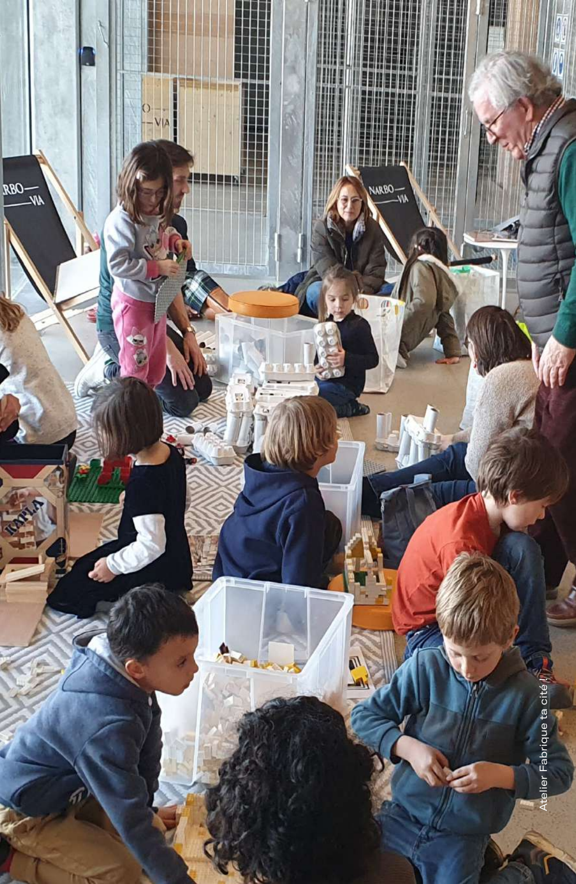
Atelier Fabrique ta cité !!