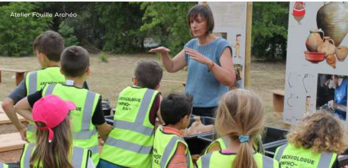
Atelier Fouille Archéo

Capacité d'accueil: ½ groupe avec 1 accompagnateur-trice, sur réservation obligatoire.