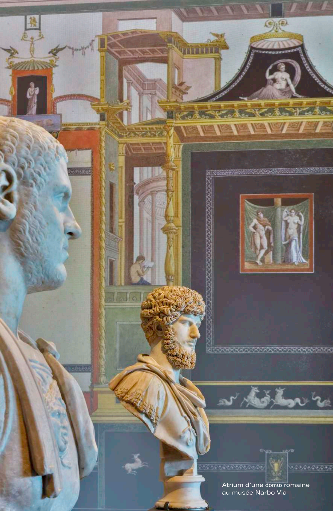
Atrium d'une domus romaine au musée Narbo Via