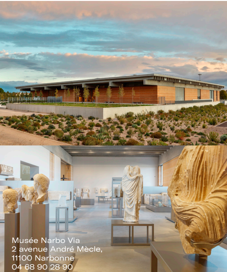
Musée Narbo Via 2 avenue André Mècle, 11100 Narbonne 04 68 90 28 90

Il propose une exposition intitulée « Lacus Rubresus » à la Maison des Arts de Bages jusqu'au 29 septembre. Durant le week-end des JEP, l'artiste viendra faire un raccrochage d'une sélection de l'exposition, au musée Narbo Via.